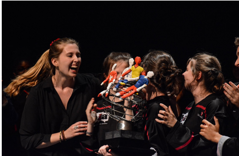
La FBIA est l'équipe gagnante du mondial 2019 et est donc championne du monde ado d'improvisation !

En 2015, la FBIA a organisé la première édition du « mondial d'improvisation junior ». Des ados venus de Belgique, de Suisse, de France et du Québec se sont rencontrés dans un tournoi international d'envergure pendant 5 jours. À Namur, Tournai et Bruxelles, plus de 1000 spectateurs ont eu l'occasion de venir applaudir ces joutes théâtrales hautes en couleur et en énergie ! Le dernier mondial a eu lieu en Suisse en 2019 et c'est la Belgique qui a remporté le trophée qui est donc devenu championne du monde ado de l'improvisation théâtrale. L'édition devait donc revenir sur les terres belges en 2020 pour que l'équipe championne remette son titre en jeu à domicile.