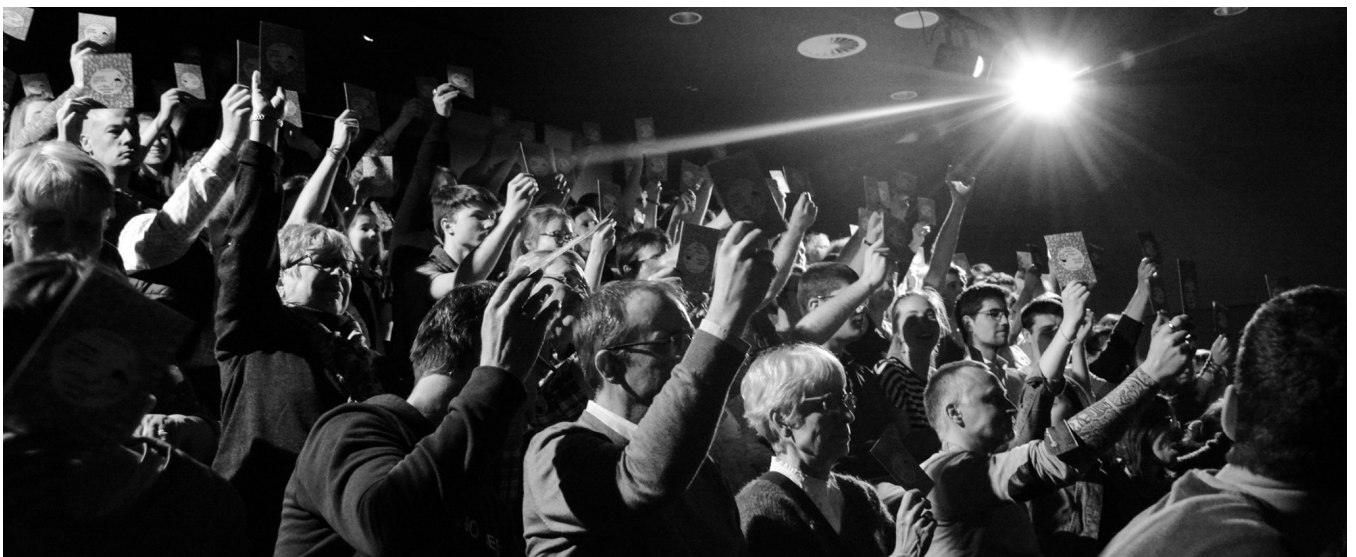
18 octobre 2019, public lors d'un match qui voyait se rencontrer les anciens de la SODA avec les nouvelles recrues.

Au niveau des spectateurs, l'improvisation théâtrale est une discipline que l'on peut appeler familial. Même si elle n'est pas adaptée particulièrement à un type de public, elle est accessible à tout public et à tout âge, que ça soit des familles, des groupes d'adolescents ou des adultes. Selon Benjamin Nathanian — Lemmens, vice-président du conseil d'administration de la FBIA , ce sont, « la plupart des temps, un public partagé entre des gens qui ont une grosse consommation culturelle dans le domaine du théâtre, du cinéma et des arts de la scène et un public qui est souvent les familles des joueurs sur scènes et leurs amis, qui lui ne consomme culturellement que l'improvisation théâtrale. »